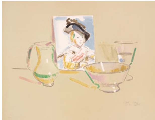
Il principe Baltasar Carlos