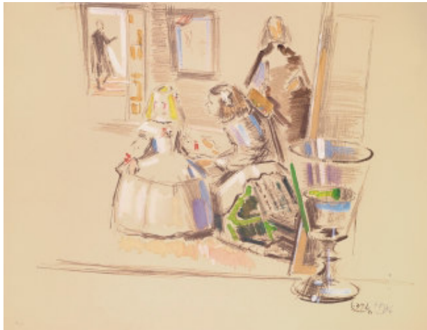
Acqua per un' infanta

Quelli che —vai a capire il come ed il perché— cercano di approfondire questa verità della pittura si notano perché sembrano scrivere quando dipingono e dipingere quando scrivono, che è come dire che facciano quel che facciano, secondo il caso, lo fanno in modo lieve, sottrattivo, sollevandosi sulla punta del pennello, come chi si sposta in aria facendo molta attenzione a mantenere il minimo contatto fisico possibile con ciò che sta a livello del suolo o, calcando le tinte, la fortuna, quando di quello che si tratta è mantenersi con la penna, ogni punta che scivola sulla carta con un monotono scribacchiare e, allora si capisce che si possono solo dire grosse verità, come questa, completamente definitiva, che la missione del dipingere è di creare un silenzio stupefacente.