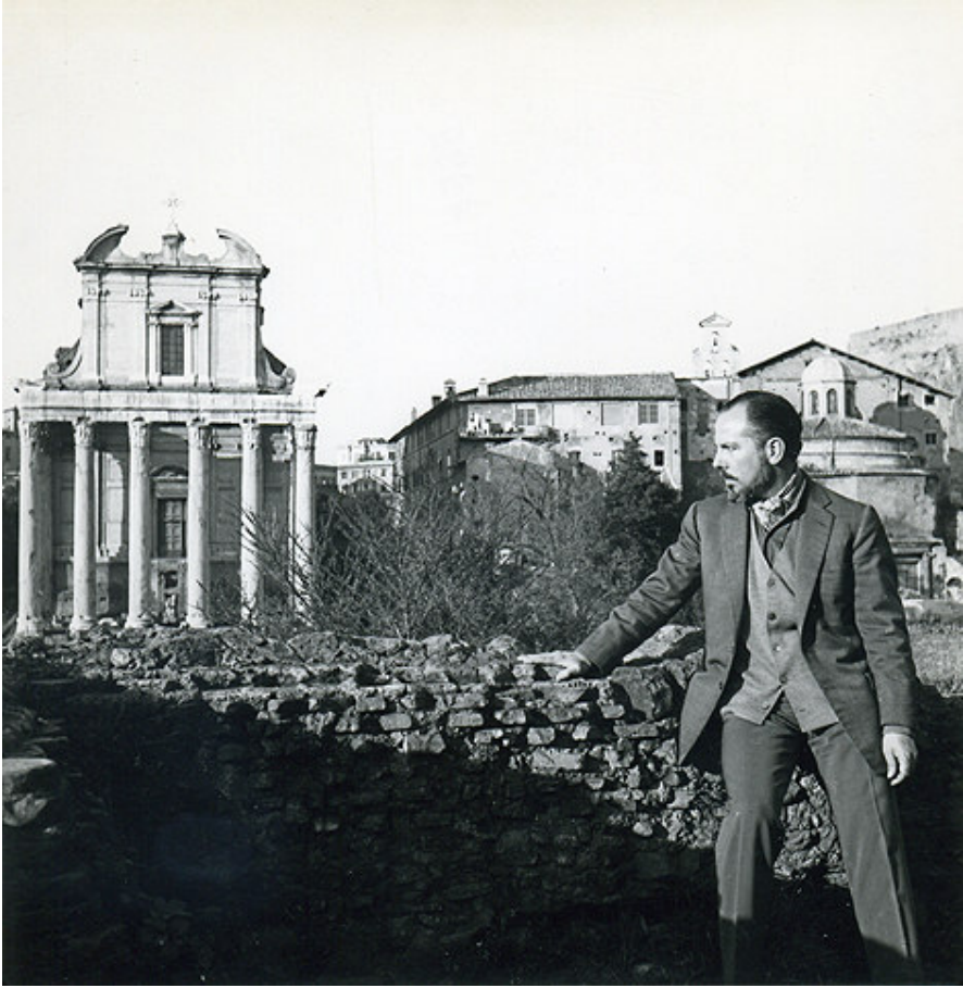
Ramòn Gaya a Roma nel 1958