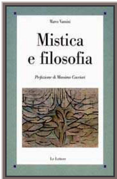
Mistica e filosofia (Le lettere, 2007)